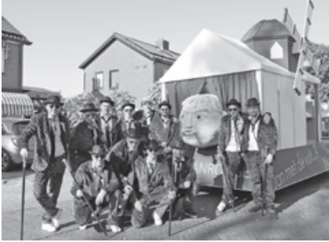
Winnaars EREPRIJS optocht 2023 - MouJanRouge

Let op! Aanpassingen route optocht Het feest gaat vrijdagavond van start met de optocht. Vanaf 19.00 uur trekt een bont gezelschap door de straten van Nijeveen. Let op! In verband met wegwerkzaamheden gaat de optocht dit jaar niet langs de Burgemeester van Veenlaan maar via de Molenweg.