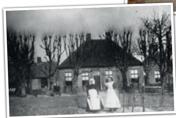
Dorpsstraat 2, vroeger en nu