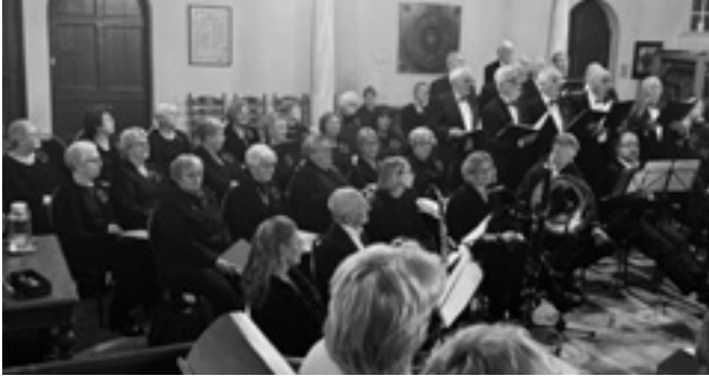
Foto gemaakt tijdens het zingen van Tibie Paiom, het (voorlopig?) laatst gezongen nummer van het mannenkoor.

Wijker Kunst zal zeker geen spijt hebben van het besluit om dit jaar geen Kerstconcert te organiseren, maar het publiek de gelegenheid te geven voor het meezingen van meerdere, met name klassieke kerstliederen tijdens de kerst(samen)zang.