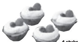
Mini cheesecake- gebakjes