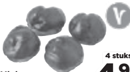
Mini Bossche bollen