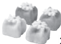
Mini marsepein- gebakjes