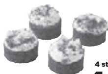
Mini red velvet gebakjes