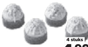
Mini witte chocolade hazelnootgebakjes