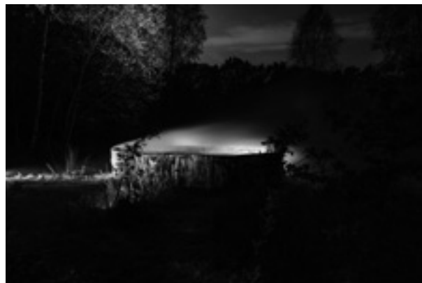
Moederboom - Beeld uit Het Schitterende Bos editie 2023

locatie met jongeren. Zo ook 'Het Schitterende Bos'. De stemmen worden vooraf opgenomen in een studio waar de jongeren worden uitgedaagd zich in te leven in de personages zonder directe reacties vanuit het publiek te ontvangen. Heel anders dus dan de stukken die gespeeld worden in samenwerking met 'Theater Na de Dam', op dit moment wordt 'Anne en de Anderen' gespeeld in voormalig Kamp Westerbork, en de Nachtelijke Beleving bijvoorbeeld.