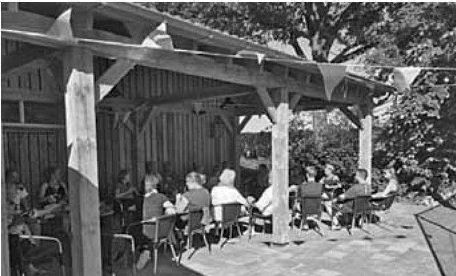
De Havelter tennissers maken gretig gebruik van de nieuwe terrasoverkapping.

Tweewekelijks regioblad voor Havelte, Uffelte, Havelterberg en Darp | Oplage: 2.800 ex. | 6e jaargang nr. 15 | 25 augustus 2021