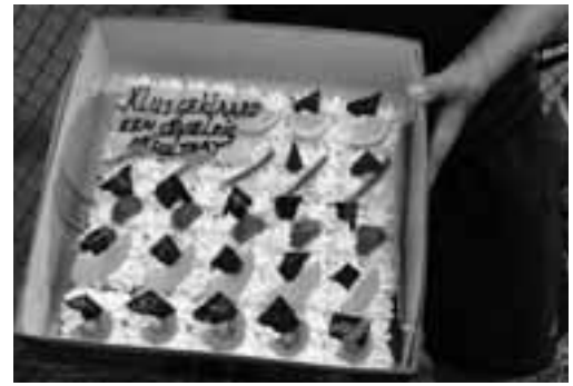
Klus geklaard. Taart voor de HTC-vrijwilligers.

Als ze daarmee klaar zijn, wacht snel een nieuwe tennisklus. Vanaf november komen de HTC'ers de winter door met de dubbelspelkampioenschappen, een evenement dat ze door coronabeperkingen twee seizoenen hebben moeten missen. Kortom: