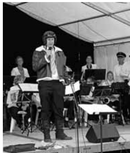
'Piet Soer' neergezet door Jesper van Dijk